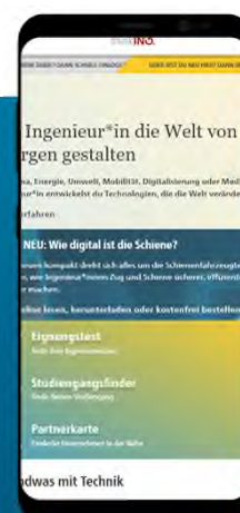
App think ING. (ab 2. HJ 2023)